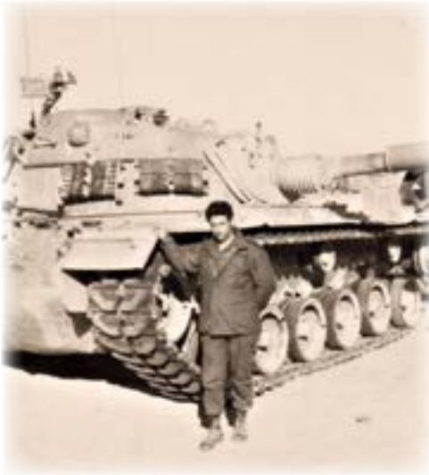
ליד טנק פטון

למחרת הגעתי לבסיס צאלים. הייתי שייך לחטיבה 500 של השריון, ובמשאית מלאה תחמושת יצאתי לכיוון סיני בשיירת משאיות.