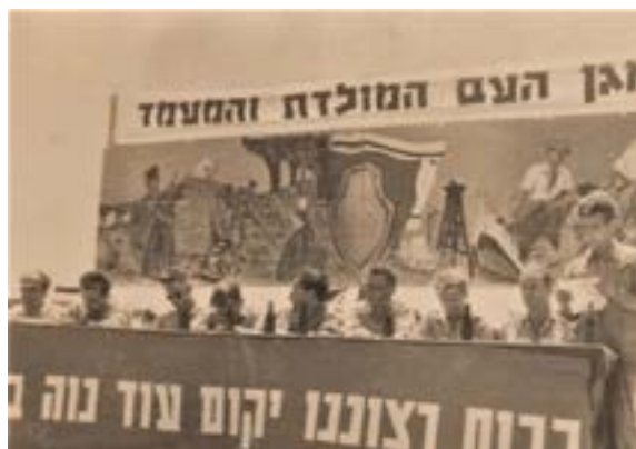
טקס העלייה על הקרקע

מגן העם, המולדת והמעמד - זו הסיסמה שהונפה מעל בימת המכובדים שהתקבצו ובאו למקום המרוחק והשומם בנגב המערבי, בו אמור היה הקיבוץ לקום.