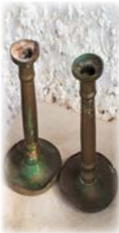
הפמוטים של אמא

אמא שמרה על המסורת ועל המצוות העיקריות. היא נולדה בבית שומר מצוות, אבל לא חרדי. לעומת זאת אבא היה חילוני גמור כפי שמכונה הדבר בימינו. לא הייתה לו תודעה יהודית ושמירת מצוות. רגליו של אבא מעולם לא דרכו בבית הכנסת - לא בשבתות ולא בחגים. הוא כיבד את רצונה של אמא בענייני הדת, אבל היו פעמים בהם נקעה נפשו מכך ולא הסכים לשתף פעולה. על רקע זה פרצו מריבות ביניהם.