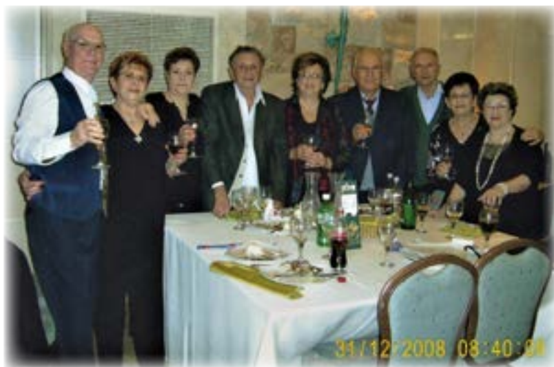
אנחנו עם חברים