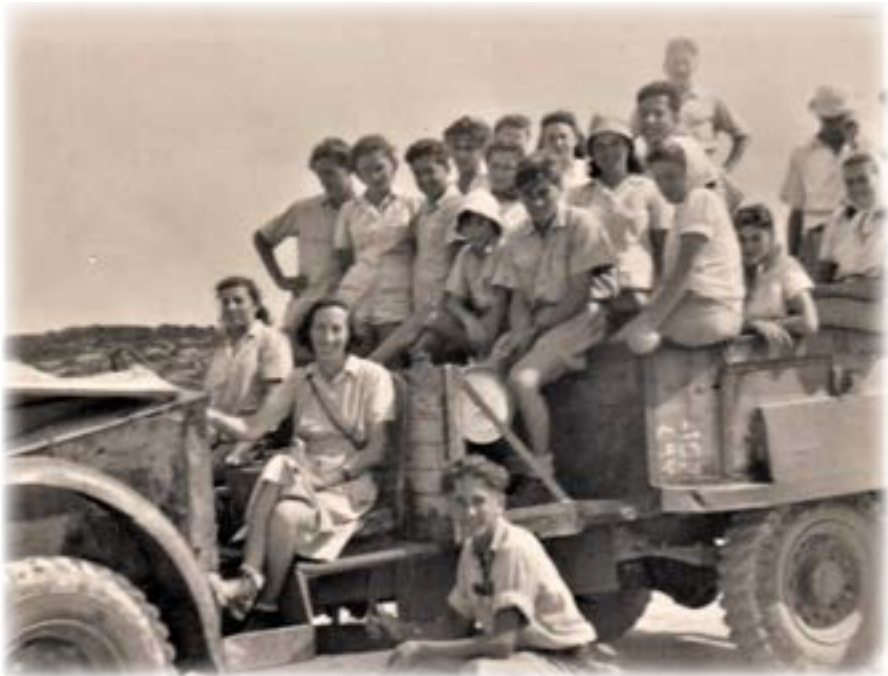
הטיול מאילון לחניתה, אפריל 1948

"עלו לכאן באמצעות פרדות וחמורים שסחבו את הקורות לצריפים, ולבניית 'חומה ומגדל'". כך שמענו הסבר על הקמת הקיבוץ והסבר על יישובי "חומה ומגדל".