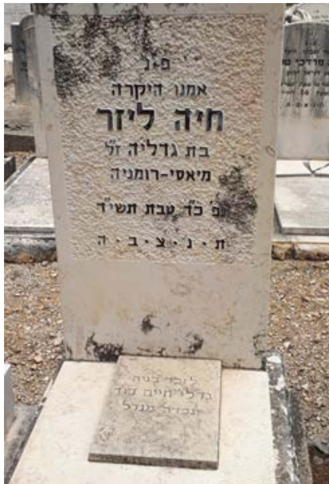
בבית הקברות הישן (סמיר) בחיפה

ססיל: צ'יריל נישאה ברומניה ובעלה שאף להגיע לארצות הברית. בניגוד אליו היא לא התלהבה מהרעיון, אבל הצטרפה ונסעה אתו.