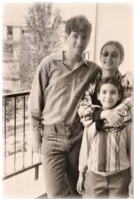
ילדינו במרפסת הדירה ברחוב סוקולוב

הייתי גאה בעצמי, האישה הזאת העריכה את עבודתי. הדירה נמכרה.