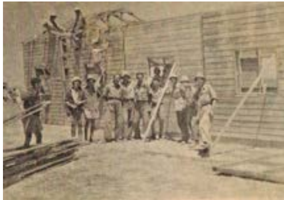
הקמת המבנה הראשון בקיבוץ מגן - חדר האוכל

השירה התפשטה בחלל המקום שנקרא בשמו הערבי שייח' נוראן, ומעתה קיבוץ מגן. המעמד המרגש תם ונשלם ואנחנו נותרנו חבורה של צעירים, להקים ולבנות את המקום ביזע ובעמל רב. החלה תקופת חיי יום ללא פאתוס ואירועים גדולים - לזרוע, לחרוש, לקצור, ועבודות אחרות קשות ומייגעות.