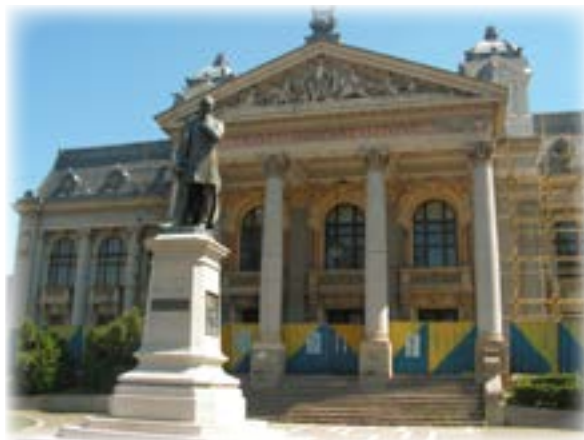
התיאטרון הלאומי ביאש

העיר יאש הייתה ידועה בקהילה היהודית הגדולה והמפוארת מזה דורות רבים. הייתה זו עיר רבת תושבים, רחובותיה הומים בני אדם, בנייניה הציבוריים מעוררי התפעלות. מרשימים ביותר היו ארמונו המפואר של מושל המחוז, שהפך ברבות הימים להיכל תרבות, וסביבו צמחייה מטופחת, בניין האוניברסיטה, שהיא הראשונה שהוקמה ברומניה, מולה פארק גדול רחב ידיים המצטיין בצמחייה ענפה. אנדרטאות מפוזרות בכיכרות, ופארקים נוספים סביבה שמשווים לעיר מראה מושך עין.