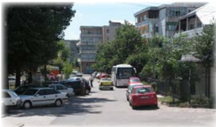
רחוב סטינְדְּרֹולֵי, כפי שהוא נראה היום