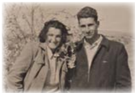
אנחנו בקיבוץ זיקים

יכולנו סוף סוף למצוא זו את זה בדממה. ההתגפפות במעלה חבילות הקש לא הצטיינה בנוחיות רבה, ולעתים אניצי הקש נתקעו במקומות שונים ומוצנעים... אך למי היה אכפת, העיקר שהרומנטיקה בלילות ירח הפיחה בנו את עינוגיה. כך התפתח רומן שנתן פרי - ילדים, נכדים ונינים, ולא פסק עד עצם היום הזה.