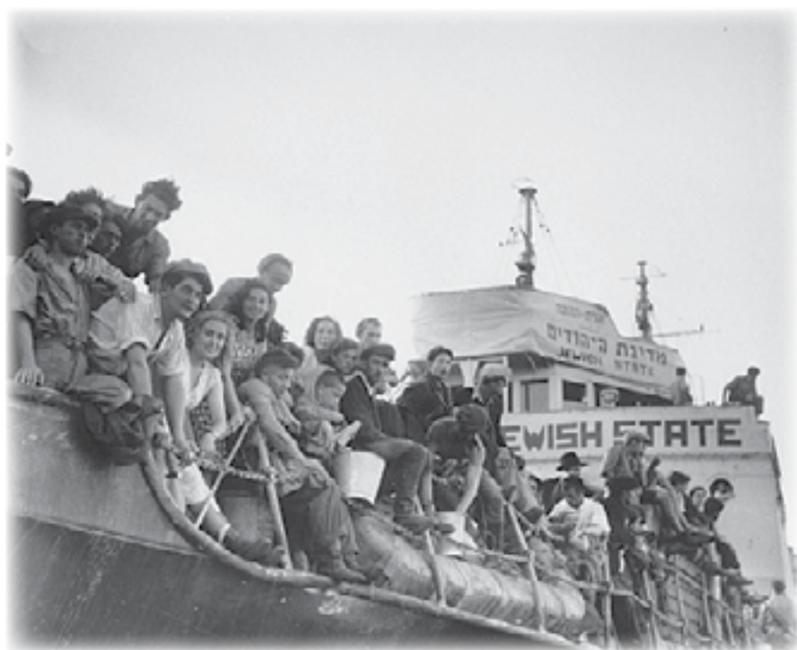
האנייה "מדינת היהודים", 1946 (צילום אילוסטרציה)

היו נוסעים שנאלצו למצוא להם מקום על הסיפון. האנייה הייתה מלאה בהמוני בני אדם ולא היה מקום "לזרוק סיכה". חיכינו במקום כשלושה ימים עד שהסתיימו ההתארגנויות, והאנייה הרימה עוגן ויצאה כשהיא מתקדמת אט אט מן הנמל אל הים הפתוח. שחפים ליוו אותנו בדרכנו. היה זה חודש ספטמבר והים השחור בו הפלגנו היה רגוע. גלים ליחכו את דופן האנייה ומסביב היה רק כחול וכחול, וגם שובל לבן של קצף הגלים.