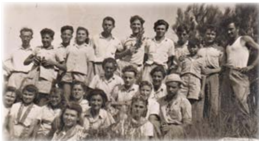
אני יושבת שנייה, למטה מימין, בטיול מאילון לחניתה, אפריל 1948

עלינו על טנדר קטן ללא גג. "אתם נוסעים לטייל היום בסביבה, לקיבוץ חניתה הסמוך". הטנדר קיפץ בדרך על פני מהמורות, בשביל העפר שהתפתל בעלייה לקיבוץ. גלגליו נמלאו בבוץ, אבל למזלנו לא שקעו,