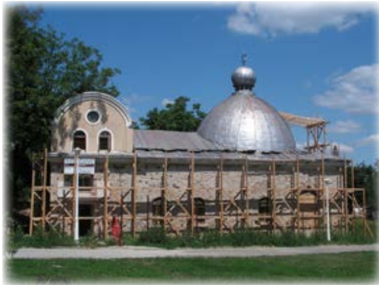
בית הכנסת הגדול ביאסי

הטלית תחת זרועו האחת וספר התפילה בשנייה, הוא ברך את המתפללים: "א גיטה שבס" (שבת שלום, ביידיש), כך היו באי המקום מברכים איש את רעהו.