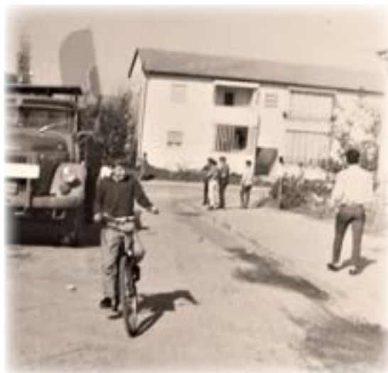
אופניים, שלל ממלחמת ששת הימים

באחד הימים נפתחה דלת הבית ושמואל עמד על הסף. לא ידעתי על בואו.