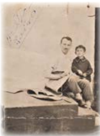
אבא ויונה ברומניה

ליקירינו שלום! לאושרנו ולשמחתנו קיבלנו אשרת יציאה מרומניה. נגיע בטיסה במועד... מתרגשים לקראת הנחיתה בארץ ומחכים לה מאוד. מתגעגעים, אמא ואבא