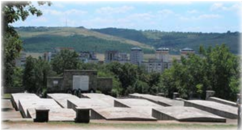
קבר אחים בבית הקברות היהודי ביאסי

נמרצת ופנה ל"יד ושם" ולא הניח עד שבעל טחנת הקמח קיבל את התואר הראוי לו.