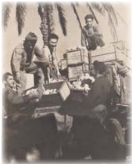
מעמיסים על המשאית בזיקים

התקבלנו כחברים ואני עבדתי על משאית. באזור נותרו בוסתנים שהיו שייכים לתושבים הקודמים שהתגוררו כאן. עציהם היו עמוסי פרי ותנובתם הייתה רבה. ולא זו בלבד, אלא שאדמת הזהב בהם צמחו הייתה מקור לא אכזב לתוצרת משובחת, עסיסית וטעימה. הענבים שצמחו על ענפי הגפנים, הסברס על שיחי הצבר ופירות הגויאבה היו כולם מתוקים וענגו את החך. הכמויות