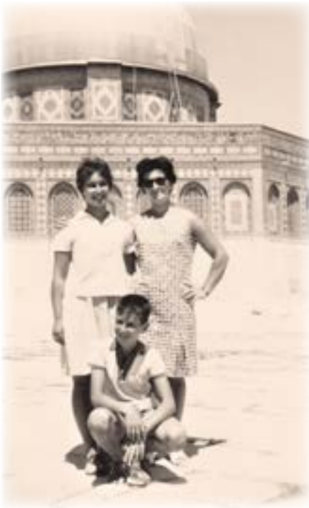
טיול בירושלים לאחר מלחמת ששת הימים