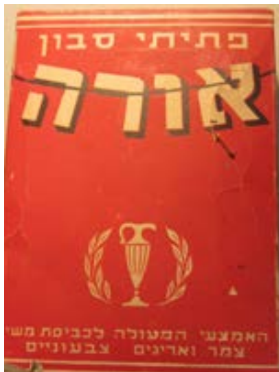
פתיתי סבון כביסה