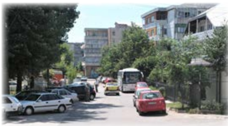
רחוב משפחת ליזר ביאש

ניצבו שם מספר בתים ולא ידענו איזה מהם היה שייך למשפחתנו ואילו לדודים שלי. בקצה הרחוב נוסף בניין דירות - שיכון מימי השלטון הקומוניסטי.