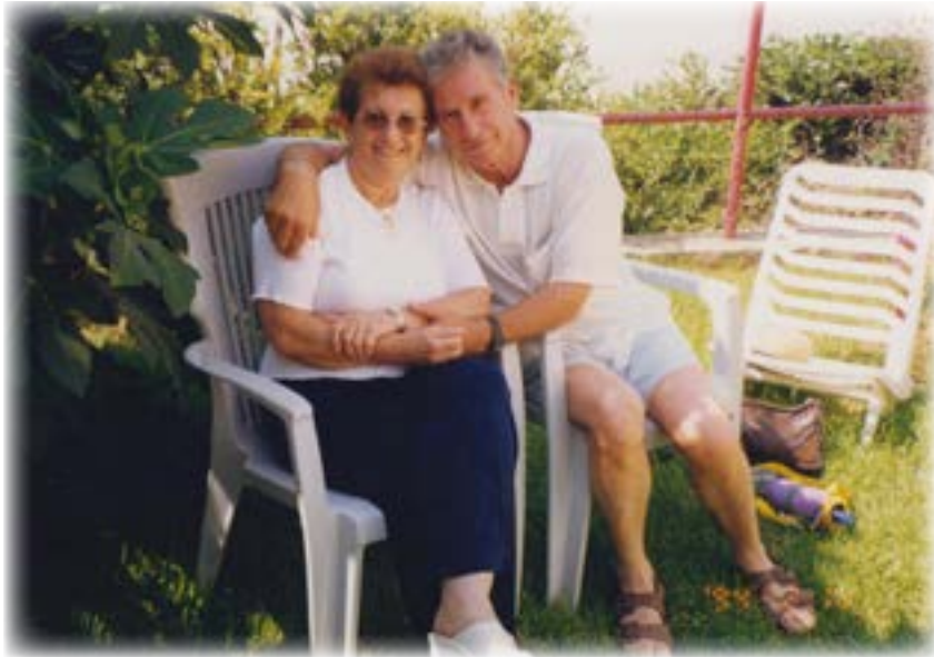
בצל עץ התאנה ברחוב משעול מורן 32 בכרמיאל

אני משתדל, עד כמה שבריאותי מאפשרת לי, להתמיד בפעילות. מלבד זאת, אנחנו מצטרפים להרצאות במועדוני קשישים. נהנים לשמוע ולהאזין בתחומי ידע חדשים ומעניינים. אנו מארחים ומתארחים אצל ילדינו, ושמחים לפגוש את הנכדים והנינים.