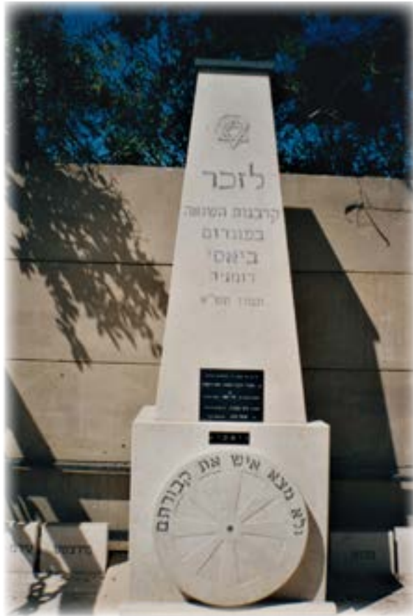
הנצחה בבית הקברות הישן (סמיר) בחיפה

היום אני מתאוה לחזור לבקר את קבר אמי, לומר קדיש, לראות שוב את מקום הולדתי והרחוב בו גרנו. סמדר, זבולון ודני ביקרו שם בטיול מאורגן וסיפרו על החוויות והתיאורים מהמקום. הם תארו את הרחוב הקטן בו גרנו כפי שזכרתי.