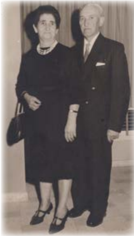
אמא ואבא בארץ

בראש השנה היינו אוכלים את ארוחת החג שהייתה דומה לארוחת יום