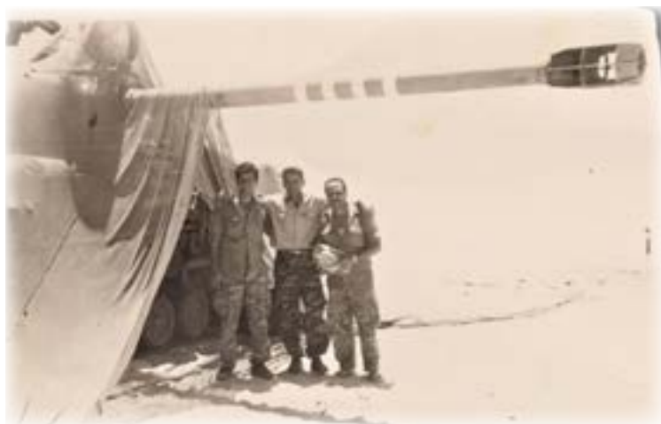
ליד טנק בקרבת תעלת סואץ

חצי האי סיני היה בידינו - תוספת שטח נכבדה. היה לנו מחסור בעיקר במים. באותה תקופה, בחודש יוני במדבר, כבר שרר חום כבד, הצמא הציקה לנו, ובאין מים משום מקור, נאלצנו לרוות את צימאוננו מהמים שברדיאטורים של המשאיות. לאחר זמן נשלחה קבוצה ראשונה לחופשה הביתה.