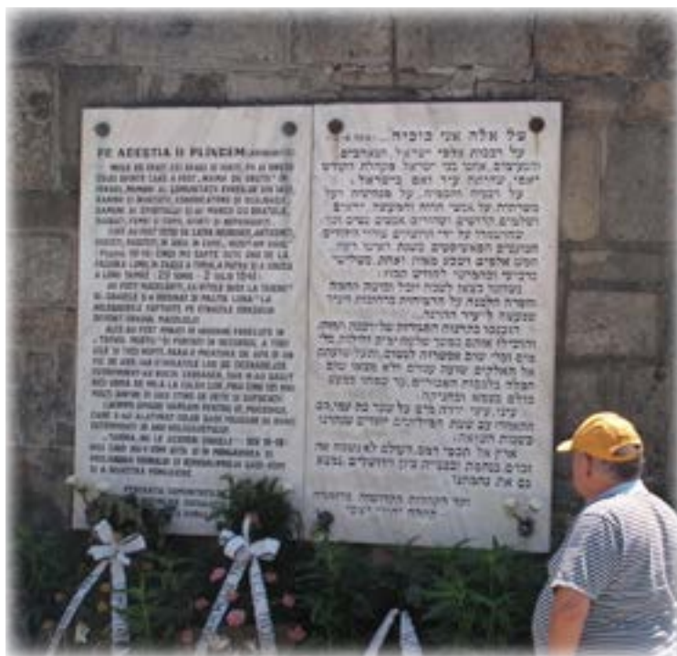
לוח הזיכרון בבית הקברות ביאש למשה: בית הקברות