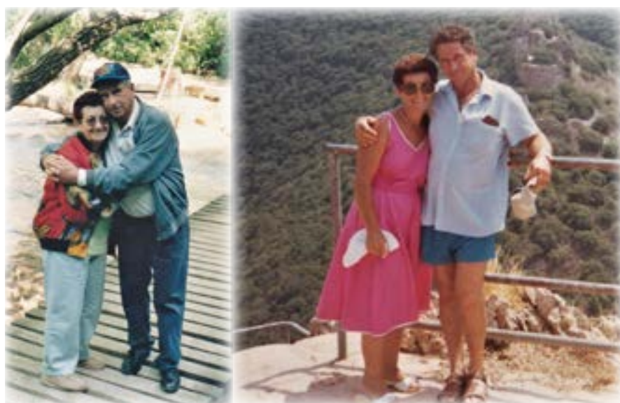
ליד מפל התנור