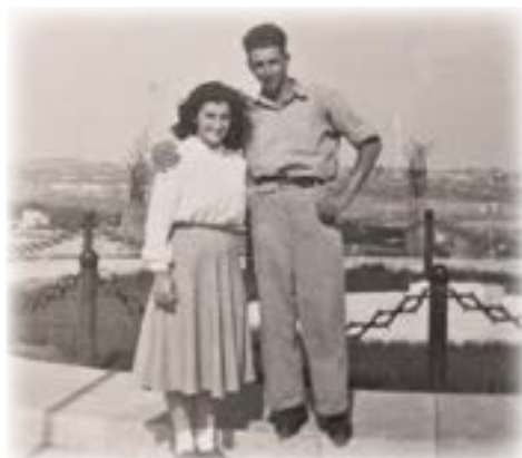
טיול בהר הרצל בירושלים

לימודי, לא ישבתי על ספסל הלימודים. אהבתי ללמוד והייתי צמא דעת וסקרן. הבנתי שזאת הזדמנות בלתי חוזרת לרכוש השכלה גבוהה ומקצוע טוב. אך לאחר הרהור שני לא הייתי בטוח שאוכל להגשים חלום וללמוד לתואר מהנדס. חיפה הייתה רחוקה באותם ימים ממגן כרחוק הארץ מהשמים, מגורים וכלכלה איש לא הציע לי.