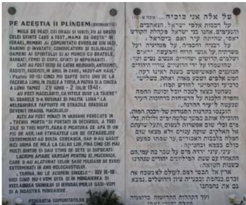
קיר הנצחה לנרצחים ביאסי