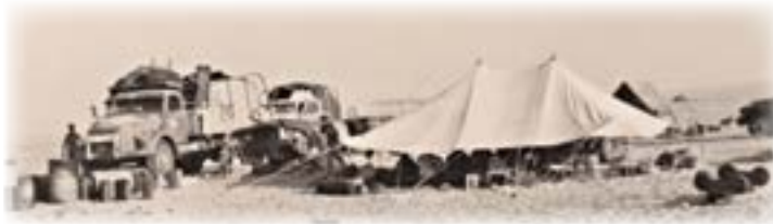
בסיני עם המשאית

המחזות המפחידים הללו, אך די היה בשמועות כדי לזרוע חשש בלבנו. עמדנו מוכנים לכל פקודה. אף אני הייתי עם הכוחות הממתינים בבסיס בקסטינה, סמוך לקריית מלאכי, עד שלבסוף החליט לוי אשכול, שהיה אז ראש הממשלה, לנהוג לפי הכלל שההגנה הטובה ביותר היא ההתקפה.