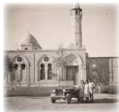
אני בהריון בבאר שבע עם ביאנקה ושמואל

סתיו. הלילות נעשו קרירים ופה ושם כבר נשמע קול טיפות הגשם,