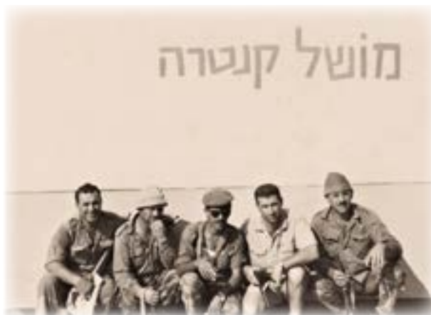
על גדות תעלת סואץ

אכן ב-5 ביוני 1967 הוזנקו מטוסי חיל האוויר וחיסלו את מטוסי האויב שהיו על הקרקע. לאחר מכן החלו כוחות היבשה לנוע. אני הייתי באותה עת מגויס עם המשאית, ששמשה את הצבא להובלת נשק ותחמושת, במסגרת מה שכונה יר"ם - "יחידת רכב מגויס", כלומר גיוס כלי רכב אזרחיים לשימוש הצבא בעת חירום. נהגי היחידה שלי, המגויסים, נהגו במשאיות שלהם עם הציוד צבאי - שהיה בדרך כלל תחמושת, כשהם נוסעים בעקבות הטנקים של חטיבה 60. בראש האוגדה עמד האלוף