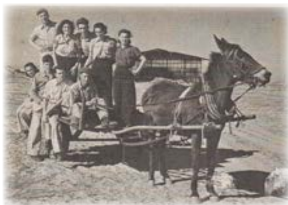
בדרך למקלחת בקיבוץ נירים

הספקת המים בברזים נוספה מאוחר יותר, לאחר שחברת מקורות הניחה צינורות באזור. היה זה שיפור רב באיכות החיים שלנו, לא היה זה מובן מאליו שיש מים בברזים. את חלקי במפעל הזה תרמתי בכך שחפרתי עם הבולדוזר את התעלות בהן הונחו הצינורות. ברצון רב עשיתי את המלאכה בידיעה שיהיו לנו מים זורמים וכך יקל עלינו ואיכות חיינו תשתפר. גם אז המים לא תמיד היו נקיים וצבעם לפעמים היה עכור, אבל היו לנו מים זורמים והיה זה הישג גדול בעינינו. בתשעת החודשים הראשונים לאחר שהתיישבנו במקום, היה עלינו להביא מים בטנקר מקיבוץ גבולות. אני הייתי נוסע להביא את המים ולעתים רבקה הייתה מתלווה אליי. הטנקר הונח בסמוך למטבח ומדי פעם יצאו החברות לשאוב ממנו מים בדלי לעבודת הבישול. כדי להתקלח היינו יוצאים לקיבוץ נירים הסמוך.