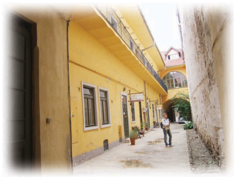
המסעך מהלונדון 49 - מקום הולדתו של אריה

אבא לא חסך על טיב המשקפיים ונרכשו לי משקפיים תוצרת גרמניה "צייז פונקטל". לעיתים נשברה מסגרתם בעקבות קטטה ברחוב או משחקי כדור ואבא ללא כל טענה טרוניה קנה לי מסגרת חדשה למרות המחיר היקר.