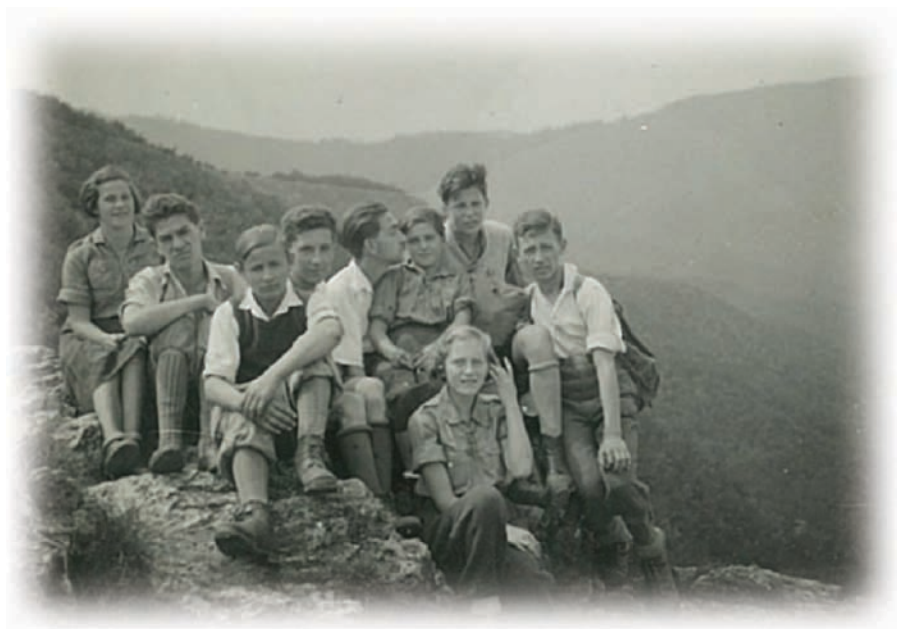
חבורה מקן השלה"3 ב"ערוות השל"2 מקפון אקליפה

בזמן שהותנו ביער הייתי מבלה זמן רב בהתבוננות בסנאים, יצורים משעשעים ביותר, שהיו מקפצים בזריזות בין צמרות העצים תוך כדי פיצוח אגוזים שתלשו מעצי האגוז.