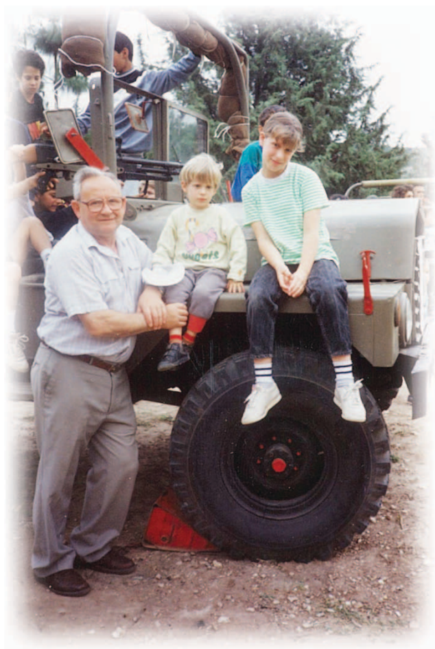
אריה, אילת וילאבה בתצוגת נשק ביום הצנאות

בהמשך מוניתי לראש מדור הנדסה - המדור כלל צוות שעבד על במספר פרויקטים, רובם עסקו במעבר מפיתוח לייצור.