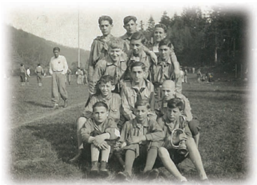
טיוו עם קבוצת הילי le תנועת הלה"3 בקליזבה

כל המחנה הקיץ לשמע זעקות השומר שהותר בינתיים מכבליו, נשמעה