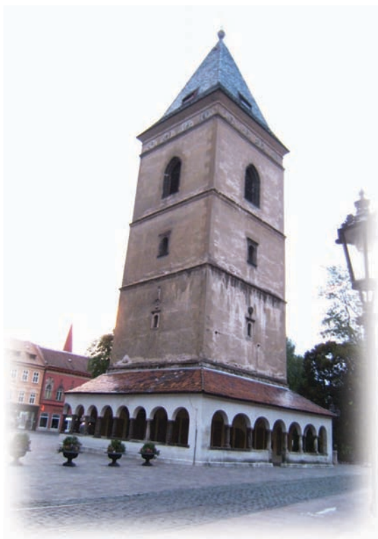
מגדל אורכן - ברחוב הראשי של קלויצה - הולנד

בתקופה מאוחרת יותר החלו להיבנות מבנים מודרניים יותר בצורות ישרות ובעלי גגות שטוחים. בחורף היו מהלכים האנשים עם מעילים עבים ומגבעות בעלי שוליים רחבים לראשם, בקיץ היו הבריות לבושים בבגדים קלים, חולצות קצרות שרוול, הנשים לבושות בשמלות. עדיין לא הגיעה לעולם אופנת המכנסיים לנשים. החנויות ובתי המסחר היו פתוחים בסמוך למדרכה. בעיירתנו היו גם פעילויות תרבות ותיאטרון. בניין התיאטרון המפואר ניצב במרכזה של העיר ליד הכיכר שבה היתה מזרקה.