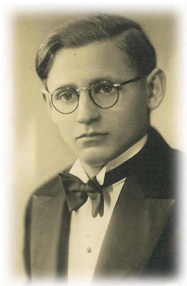
אריה - מתוך תמונת המחזור של בית הספר המקצועי לתעשייה

שנת 1938 היא שנת מפנה בגרמניה ובאירופה כולה. גרמניה הנאצית כובשת את צ'כוסלובקיה ומספחת את אוסטריה. נחתם הסכם בין גרמניה ובין צרפת ובריטניה לפיו מסכימות שתי האחרונות לכך שגרמניה תשתלט על איזור הסודטים הצ'כי. בהסכם מינכן ניתן הכשר להשתלטות על האיזור הזה בהתחלה ואחר כך השתלט היטלר על כל צ'כוסלובקיה. הסלובקים נפרדו מצ'כיה והוקמה מדינה סלובקית נפרדת. חלקים ניתנו להונגריה. לפי ההסכם איזור דרום סלובקיה כולל קושיצה עבר לידי הונגריה. החלה תקופה חדשה, קשה ואיומה באירופה.