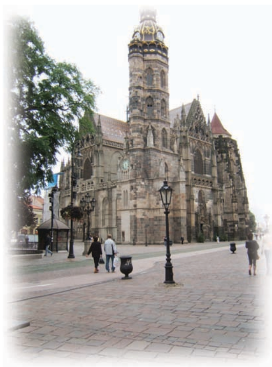
הקתדרלה ברחוב הראשי le קליצה - האולאנה

ברחובה הראשי של העיר היו נטועים שדרות עצים בצידי הרחוב ליד המדרכות והצלו על העוברים והשבים. בתי העיר נצבו משני עברי הרחוב ועל גגות הרעפים שלהם בלטו ארובות האבן שהיו עשונות בחורף והפיצו ריח מתקתק של עצים נשרפים. חלונות הבתים היו ארוכים וגדולים, מהם אפשר היה לצפות אל הרחוב. צריחי הכנסיות התחדדו מול הרקיע והתריסו מול השמים. צלצולי הפעמונים נשמעו תדיר ברחבי העיר. הכנסיות היו בנויות בסגנון גותי, מעוטרת בקדושים ופניו ישו הצלוב נבטו אל הרחוב.