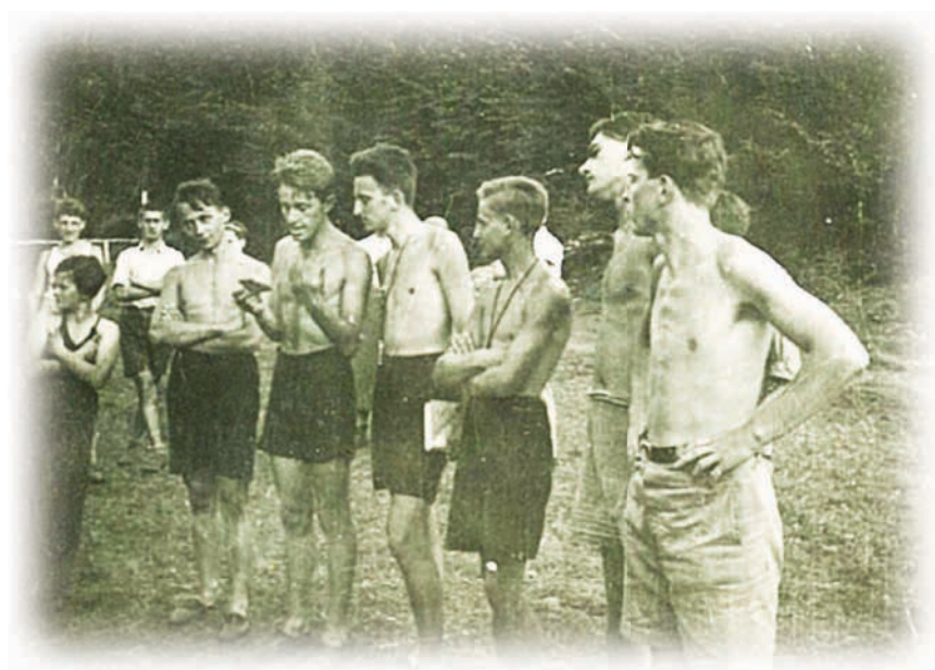
"מלכת קיץ" - מחנה נאור של השלה"צ באיזור היערות,

"אינכם יודעים כמה יפה היא ארץ ישראל" היו השליחים מארץ ישראל מספרים לנו. הם תיארו את הגליל הפורח בשלל צבעים בחורף ובאביב, את הכינרת והירדן השוצף מים. ליבי יצא אל המקומות הללו.