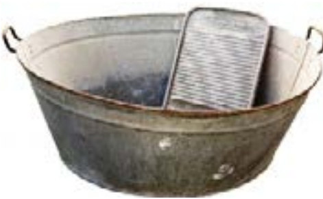
פיילה (גיגית כביסה)

הכבסים. לאחר מכן הוצאתי אותם והעברתי לגיגית (פיילה), שפשפתי את הכתמים על גבי גליל פח באמצעות גוש סבון כביסה גדול, בדיוק כאותו אחד שבאמצעותו כיבסנו בכפרנו בכורדיסטן. ידיי האדימו וגם גבי הכפוף החל לאותת לי שלא נוח לו. כעת היה עליי לשטוף את הסבון, לסחוט ולתלות.