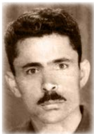
אני בן 20 בערך

את הפקיד בשדה התעופה בארץ בגילי האמיתי. וכך, לפי הרשום בתעודת הזהות אני היום בן 104 - מבוגר בכ-12 שנים. עובדה זאת גרמה לכך, שלפעמים נקבעו לי דברים שלא לפי גילי המדויק. למשל, יציאה לגמלאות הרבה לפני שהגעתי לגיל המתאים, כאילו הייתי אח של אבא ולא בנו. אבל איש - גם לא אני - לא נתן דעתו לפרטים שוליים כאלה באותם ימים של קליטת עולים בשנות החמישים.