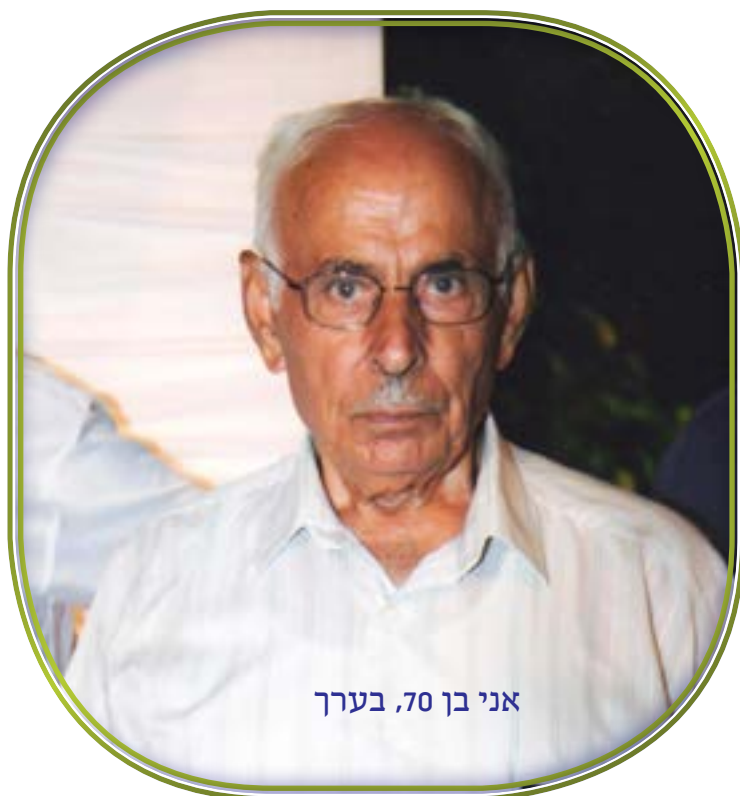
אני בן 70, בערך

אפילו סייעו בעבודות אחזקה ותיקונים. גם אבא תרם את חלקו ועבד במכירה במזנון. לאחר יום עבודה מפרך במפעל, הייתי מזדרז להגיע לקולנוע, וכך ללא מנוחה ממשיך עד לשעות המאוחרות של הלילה. זה היה בשנות השבעים. אך בשנות השמונים הטלויזיה כבר שידרה בצבע, מכשירי וידאו היו בבתים רבים. הטכנולוגיה התפתחה, אנשים קנו מכוניות והחלו לצאת למקומות בילוי אחרים, מחוץ לעיר. צופי הסרטים פחתו והרווחנו פחות ופחות, עד שקיבלנו החלטה לסגור את המקום. "איך אתם מוכרים מקום כזה?" התפלאו אנשי המקום. והוסיפו: "תעשו עסק אחר אם בית הקולנוע איננו רווחי". קבלן מקריית שמונה קנה את המקום, הרס את המבנה ובמקומו נבנו ונפתחו חנויות.