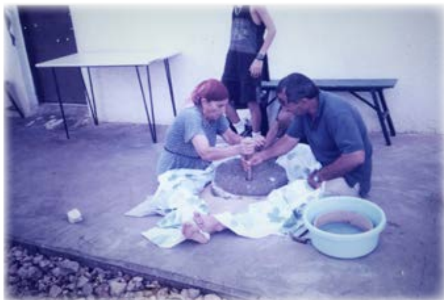
טוחנת באבן ריחיים

לאחר שהילדים סיפרו לי על יומם בבית הספר, פניתי לכבס את הכביסה שהצטברה. על הפרימוס עמד דוד ובו מים שרתחו, לתוכו הכנסתי את