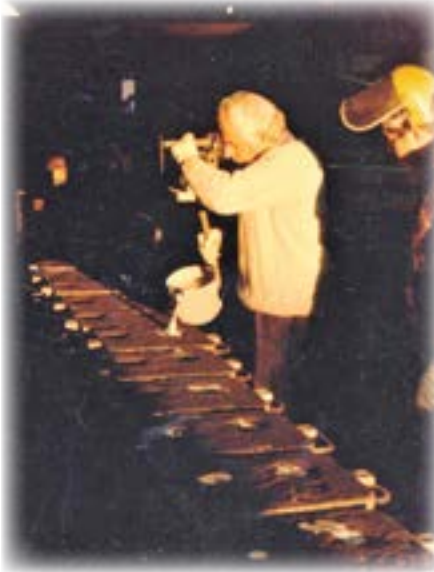
אני בעבודתי במפעל

הסתבר שגם בנה עבד שם, והיא זיהתה את הריח שנדף ממני, המיוחד לעובדים בהתכת מתכות, ואין זה ריח בושם בלשון המעטה. אך הייתי מרוצה שאני עובד ומפרנס. עשינו עבודות למפעלים, ארגונים וחברות ידועות בארץ, כמו קיבוץ עמיעד. לקוחות גדולים היו התעשייה הצבאית, רפא"ל ועוד.