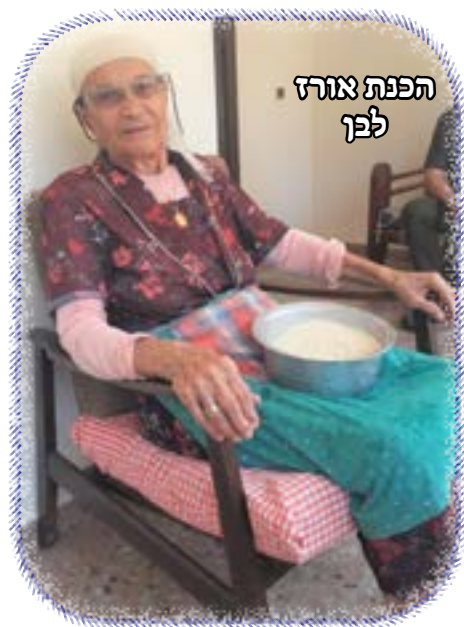
הפנת אורז לפן

הקיימים בימינו. כיום, יש לנו בבית את כל הדרוש לעבודת הבית, ואני עדיין עובדת הרבה וקשה למרות גילי המתקדם.