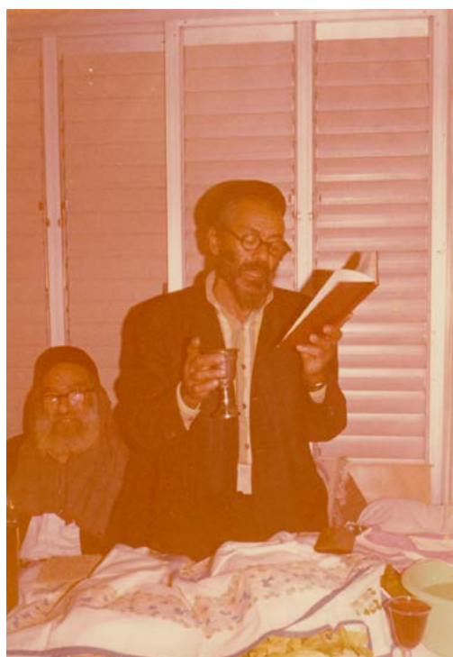
אבא וזכריה בליל הסדר, פסח תשל"ד,

פירושו בארמית: סבא בבית טוב בבית - סבתא בבית אור בבית.