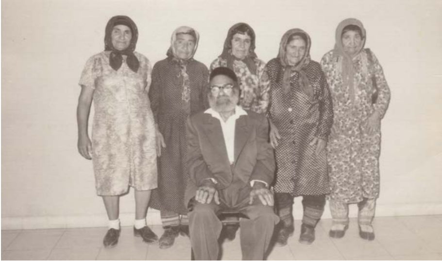
אחיותיו של אבא לפי סדר הולדתן מימין לשמאל. בסדר זה גם נפטרו