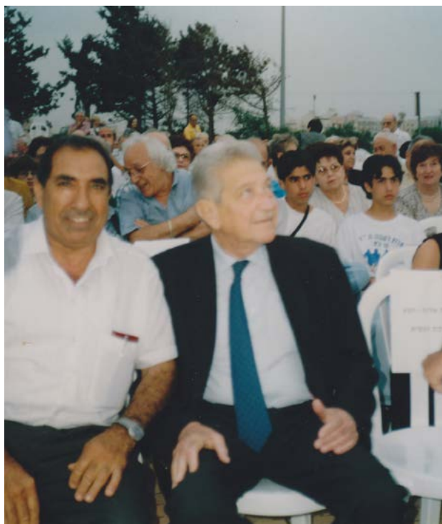
בעצרת יום הזיכרון, עם הנשיא ויצמן. מחנה דורה, נתניה, מאי 1996