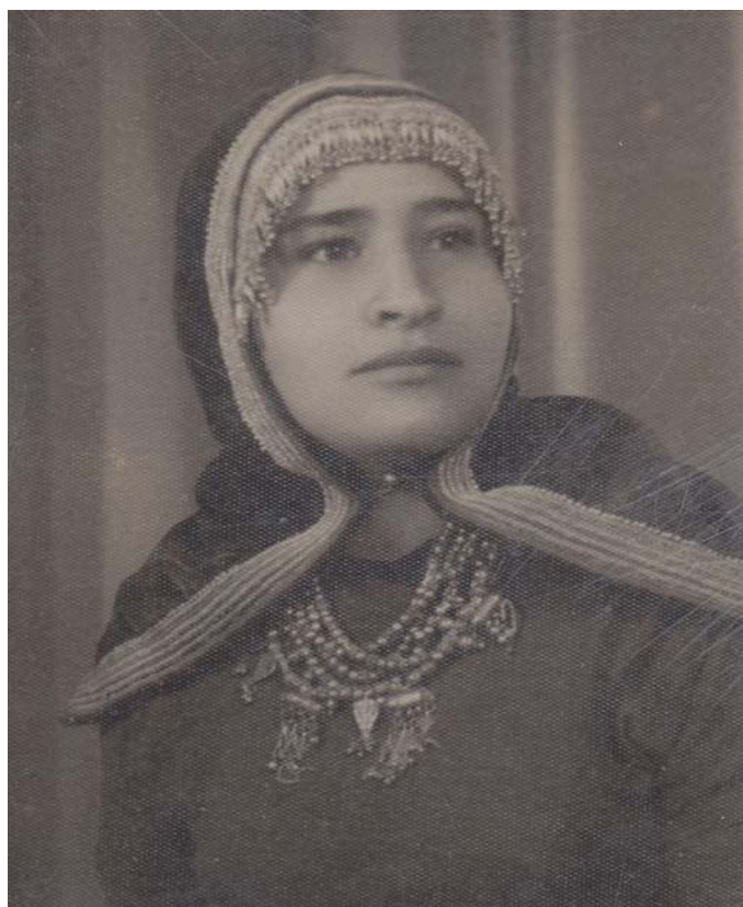
יונה בלבוש תימני מסורתי

הנשים ישבו עם הילדים בשולחן נפרד. בשבת יכלו גם הן סוף סוף לנוח מהעבודה