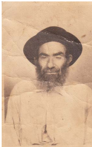
אבא, שלום בשארי, 1952 ציטוט: זקן אני, אך לבי צעיר. עוד ביכולתי - בארצנו הקדושה - לבנות עיר.

הבית שימש כבית ועד הקהילה, כי אבא היה הגביר בקהילה. היו שעות בהם ישבו